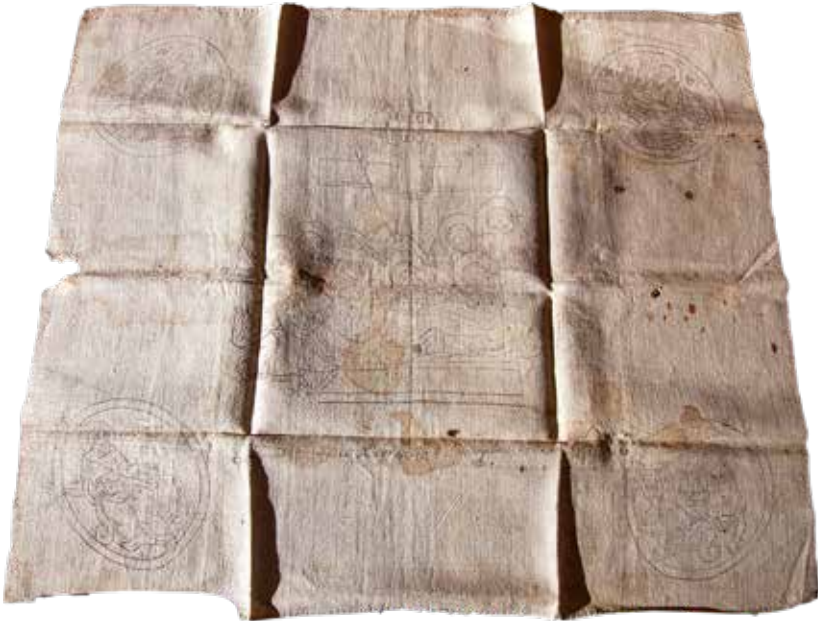
Τό ἱερό ἀντιμῆνσιο