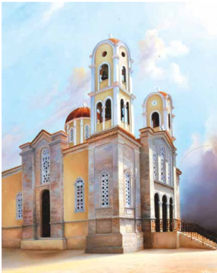
Ο καθεδρικός ναός τῆς Ἐπισκοπῆς, ἀφιερωμένος στήν Αγία Τριάδα, στόν ἅγιο Προφήτη Ἡλία καί στόν ἅγιο Ἀντώνιο τόν Μέγα. Πίνακας φιλοτεχνημένος ἀπό τόν ζωγράφο Κωνσταντίνο Τοσουνίδη.