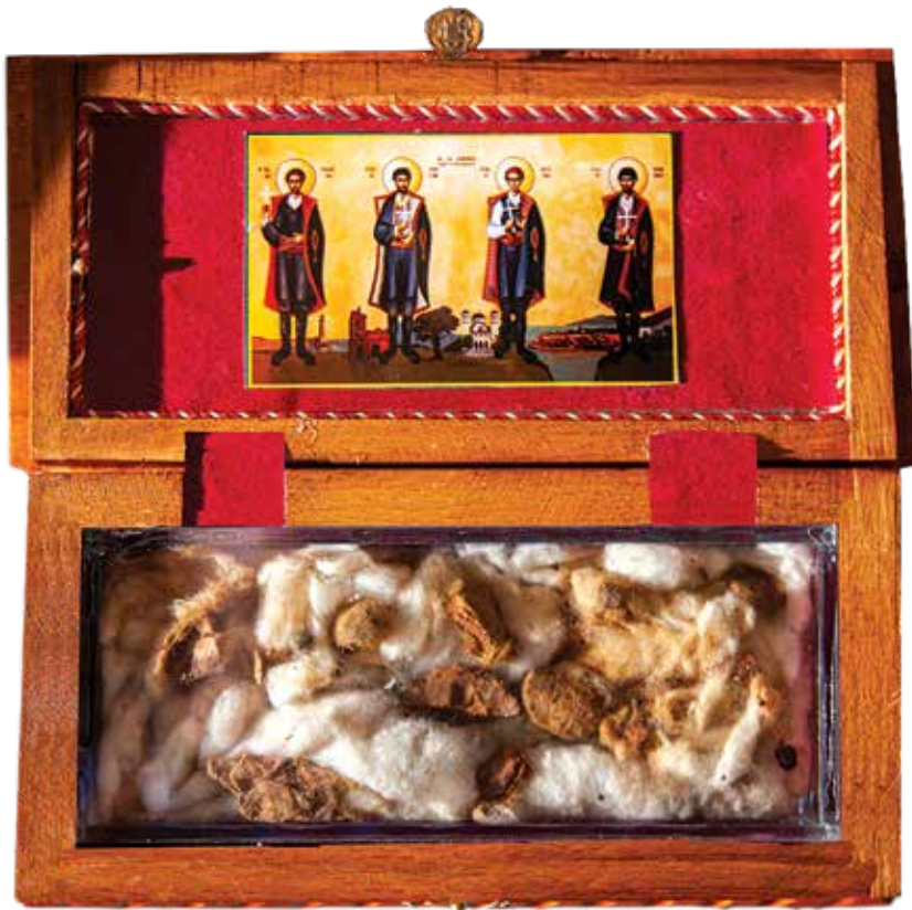
Βαμβάκι έμποτισμένο στο αίμα τών άγιων Τεσσάρων Μαρτύρων, ανάποφευκτα άνακατεμένο μέ χώμα

«Ο λαός τής Κρήτης είναι από τή φύση του και τή θέση του συναισθηματικός. Η συναισθηματικότητά του αυτή έπενεργεί στο φιλότιμο. Τό φιλότιμο στή φιλοξενία. Η φιλοξενία στήν κοινωνικότητα. Η κοινωνικότητα στή φιλία. Η φιλία στήν ένότητα. Η ένότητα στήν άποφασιστικότητα. Και ή άποφασιστικότητά του γίνεται ήρωϊσμός και άγιότητα. Ήρωες Άγιοι είναι οί Άγιοι Τέσσερεις... Ένάρετης οικογένειας έκβλαστήματα. Ηρωϊκής γενιάς κλάδοι.