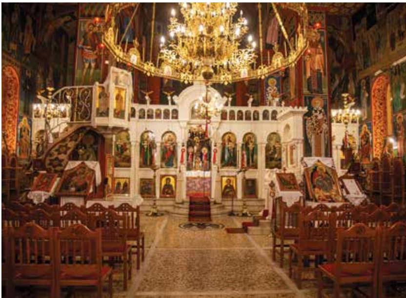
Τό ἐσωτερικό τοῦ ἱεροῦ καθεδρικοῦ ναοῦ τοῦ Προφήτη Ἡλία.