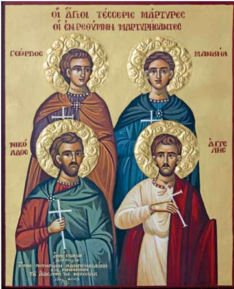
Οἱ ἅγιοι Τέσσερις Μάρτυρες, διὰ χειρὸς Ἐφης Ποτηράκη - Λαμπρινουδάκη, 2005. Βρίσκεται στὸν ἱερό ναό τοῦ Προφήτη Ἡλία στήν Ἐπισκοπή.

πρῶτο θαῦμα τῶν Τεσσάρων Μαρτύρων ἀφορᾷ μιά τυφλή Τουρκάλα (καὶ μάλιστα τὴ μητέρα τοῦ δημίου πού τούς ἀποκεφάλισε!), ἐνῶ, ἀμέσως μετὰ τὸ μαρτύριο τοῦ ἁγίου Γεωργίου τῶν Ἰωαννίνων, τὸ 1838, μιά Τουρκάλα ἄρπαξε τὴν κάλτσα ἀπὸ τὸ πόδι του, καθὼς κρεμόταν στὴν ἀγχόνη, καὶ ἔτρεξε σὲ μίαν ἄλλη, ἄρρωστη Τουρκάλα, τῆς τὴν ἔφερε σάν φυλαχτὸ καὶ ἐκείνη «ἔθερα-πεύθη ἀμέσως». Γι' αὐτὸ καὶ σὲ κάποιες εἰκόνες ὁ ἅγιος