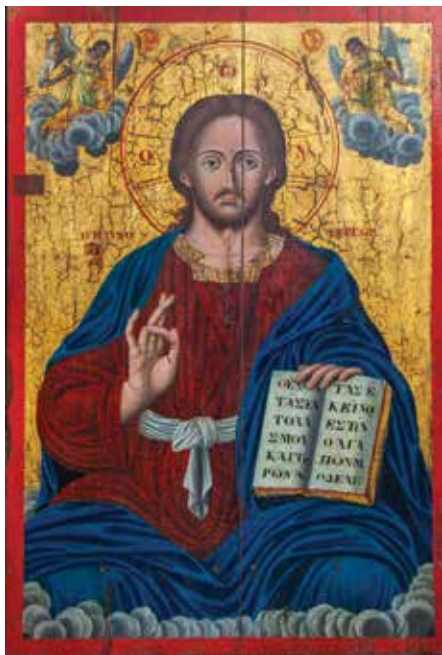
Ὁ Ἰησοῦς Χριστός (1853) εἰκόνα ἱστορική ἀξίας πού βρίσκεται στόν ἱερό ναό τοῦ Προφήτη Ἡλία Ἐπισκοπῆς, διά χειρός Ἀντωνίου Βεβελάκη

Ο Εὐαγγελισμός τῆς Θεοτόκου (1835). Βρίσκεται στον Καθεδρικό Ναό Ἐπισκοπῆς Ρεθύμνης. Ἔργον Ἰωάννου Φραγκόπουλου τοῦ Ζακυνθίου, ὁ ὁποῖος ἀγιογράφησε τό 1836 τήν πρώτη εἰκόνα τῶν Τεσσάρων Μαρτύρων.