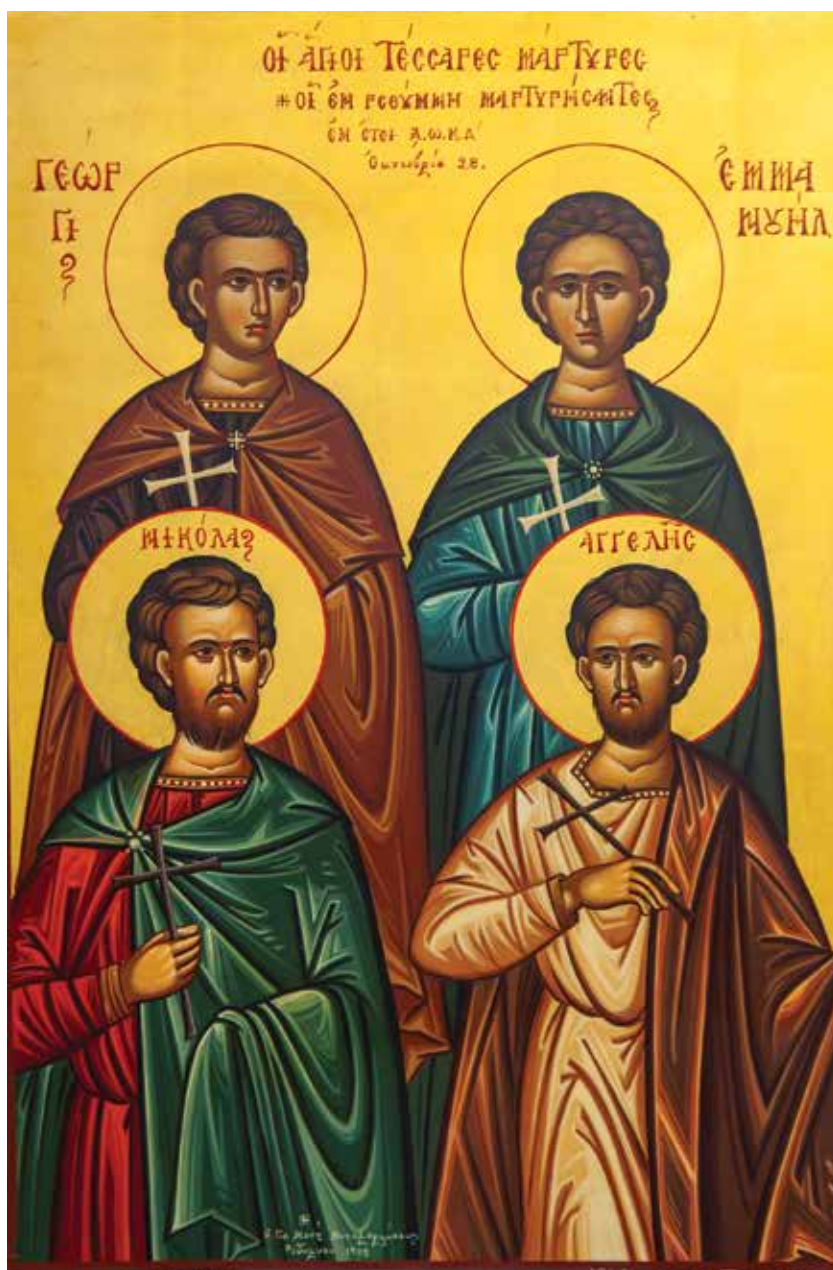
Οί άγιοι Τέσσερις Μάρτυρες, εικόνα άγιογραφημένη στην Τερά Μονή Σωτήρος Χριστού Κομπέ Ρεθύμνης τό 1998.