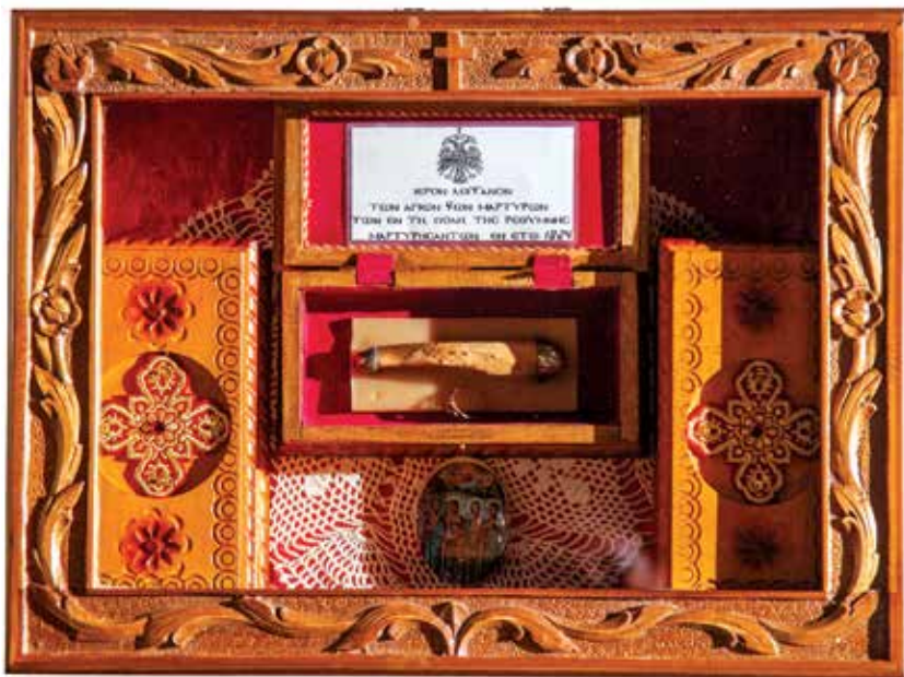
Ὀλόκληρη ἡ λειψανοθήκη, ὅπου φυλάσσονται τὰ ἱερά κειμήλια