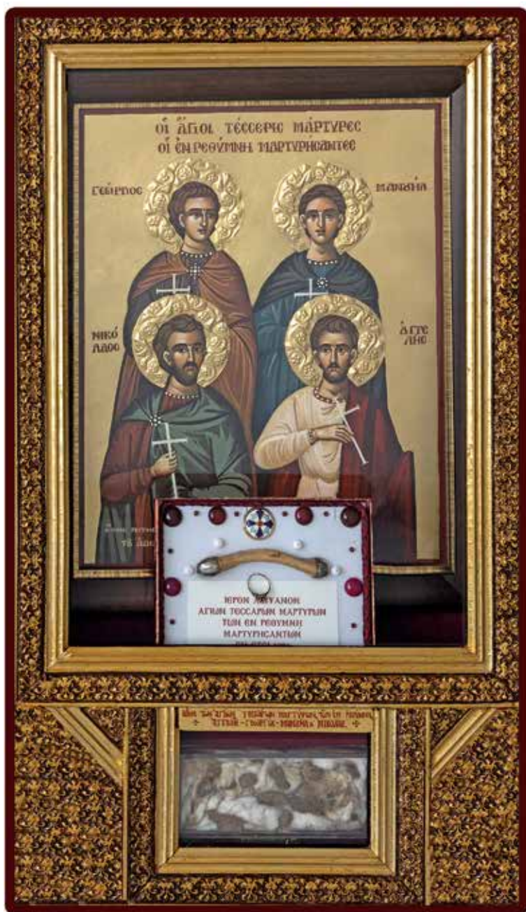
Ἡ εἰκόνα, τὸ Ἱερὸν Λεῖψανον καὶ τὸ αἷμα τῶν Ἁγίων Τεσσάρων Μαρτύρων μέσα σέ νεότερη εἰδική θήκη στὸν Ἱερό Ναὸ Προφήτου Ἡλιοῦ Ἐπισκοπῆς Ρεθύμνης